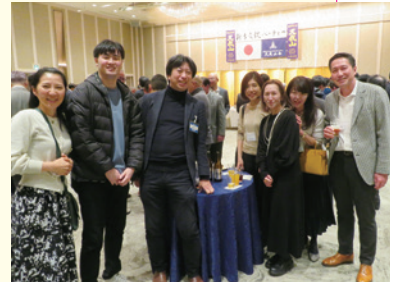
写真は令和6年 「新年交歓パーティー」